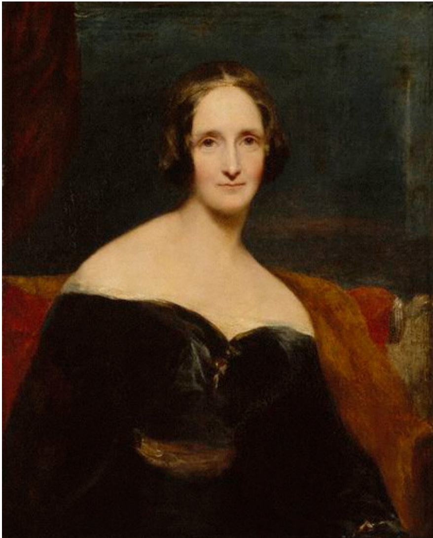
Richard Rothwell: Mary Wollstonecraft Shelley, Öl auf Leinwand, National Portrait Gallery, London

zuckten und die Toten mit den Zähnen knirschten und die Zunge herausstreckten. Friedrich Wilhelm III. von Preußen ließ diese unwürdigen Experimente verbieten. Doch zurück in die Villa am See. Der Abend verging und man begab sich zu Bett.