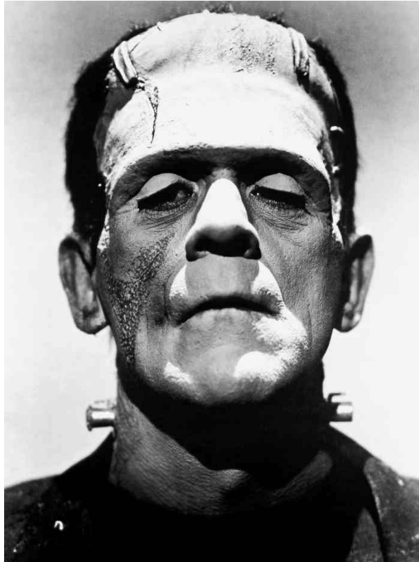
Boris Karloff als Frankensteins Monster

Auch Byron wurde in jenen Tagen zu seinem Gedicht Finsternis inspiriert.